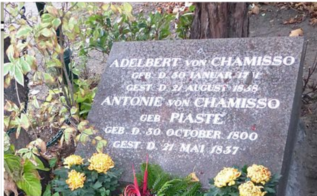
Das Ehrengrab von Adelbert von Chamisso in Berlin-Kreuzberg